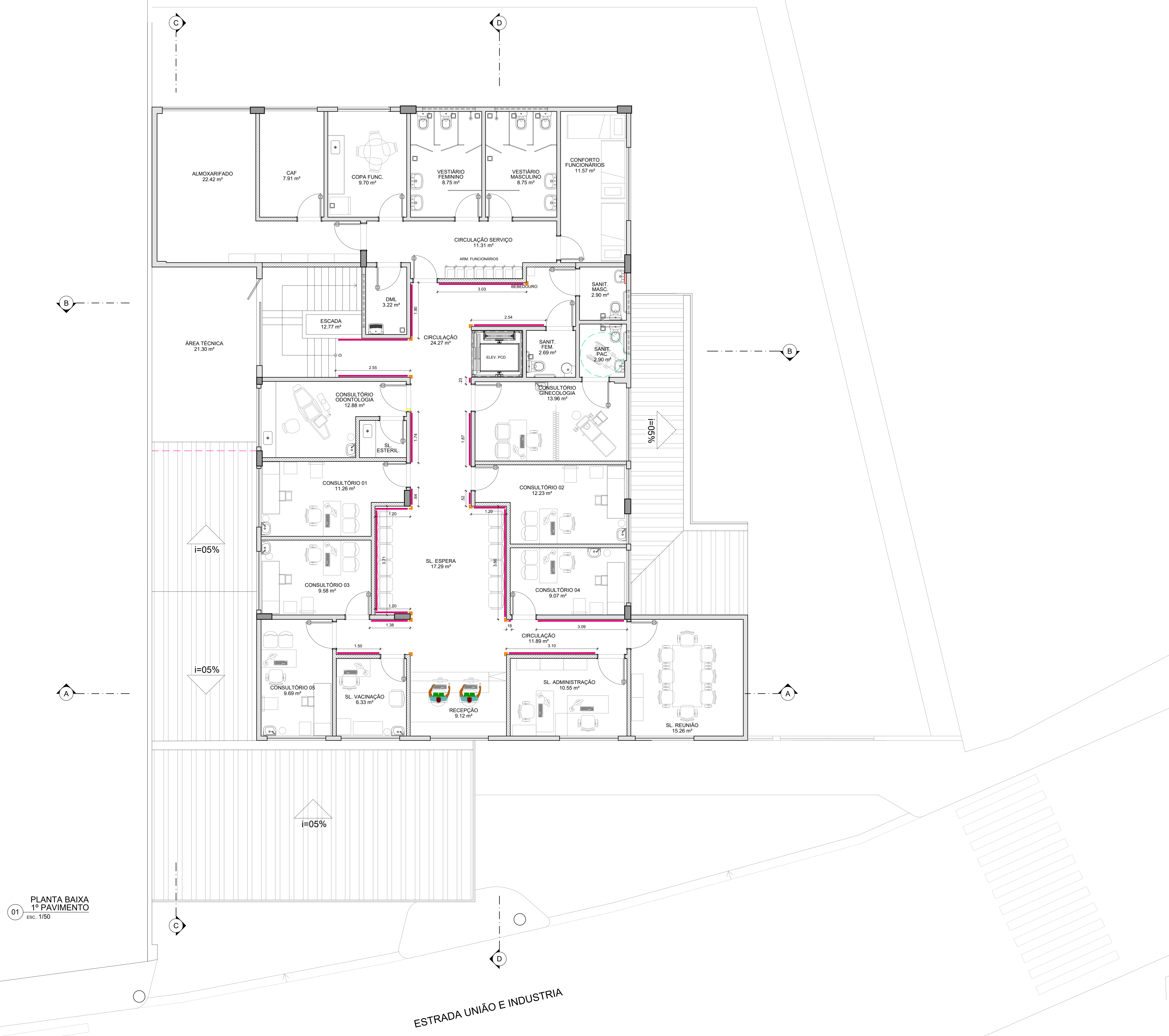
01 PLANTA BAIXA 1º PAVIMENTO ESC.: 1/50